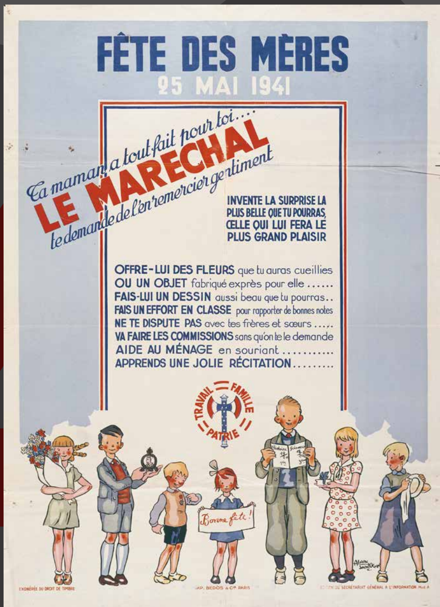
La fête des mères Affiche Centre de l’Affiche, AF 3461