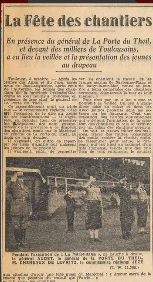
La fête des chantiers Article de presse dans La Dépêche du Midi du 6 octobre 1941 A.M.T., PRE 00