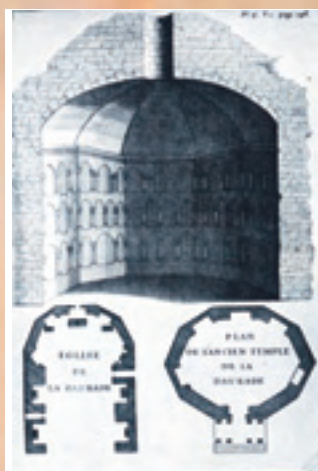
DOC 2 - Hypothèse de reconstitution du chœur de l'ancienne église Notre-Dame de la Daurade (reproduit d'après la planche publiée par Dom Martin dans La Religion des Gaulois en 1727)