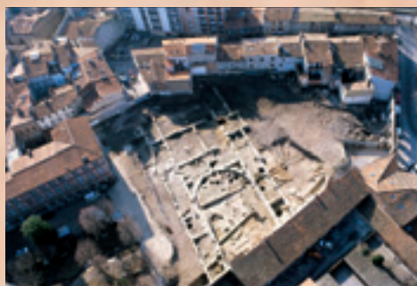
DOC 1 - Vue aérienne des fondations du palais présumé des rois wisigoths sur le site de l'ancien hôpital Larrey, 1998.

Aujourd'hui encore, les sources attestent de cette implantation.