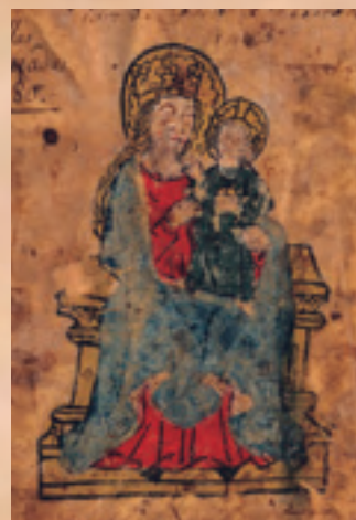
DOC 3 - Notre-Dame de la Daurade, 1481. Miniature ornant la couverture du premier livre des tailles de Toulouse. Archives municipales de Toulouse, CC 164, f° 76