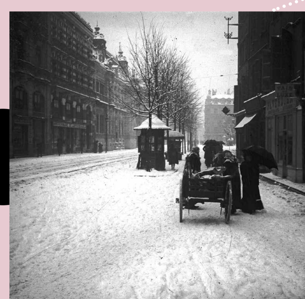
Rue du Languedoc, 1907. Photographie d'Émile Espy. Mairie de Toulouse, Archives municipales, 1 Num1/52.