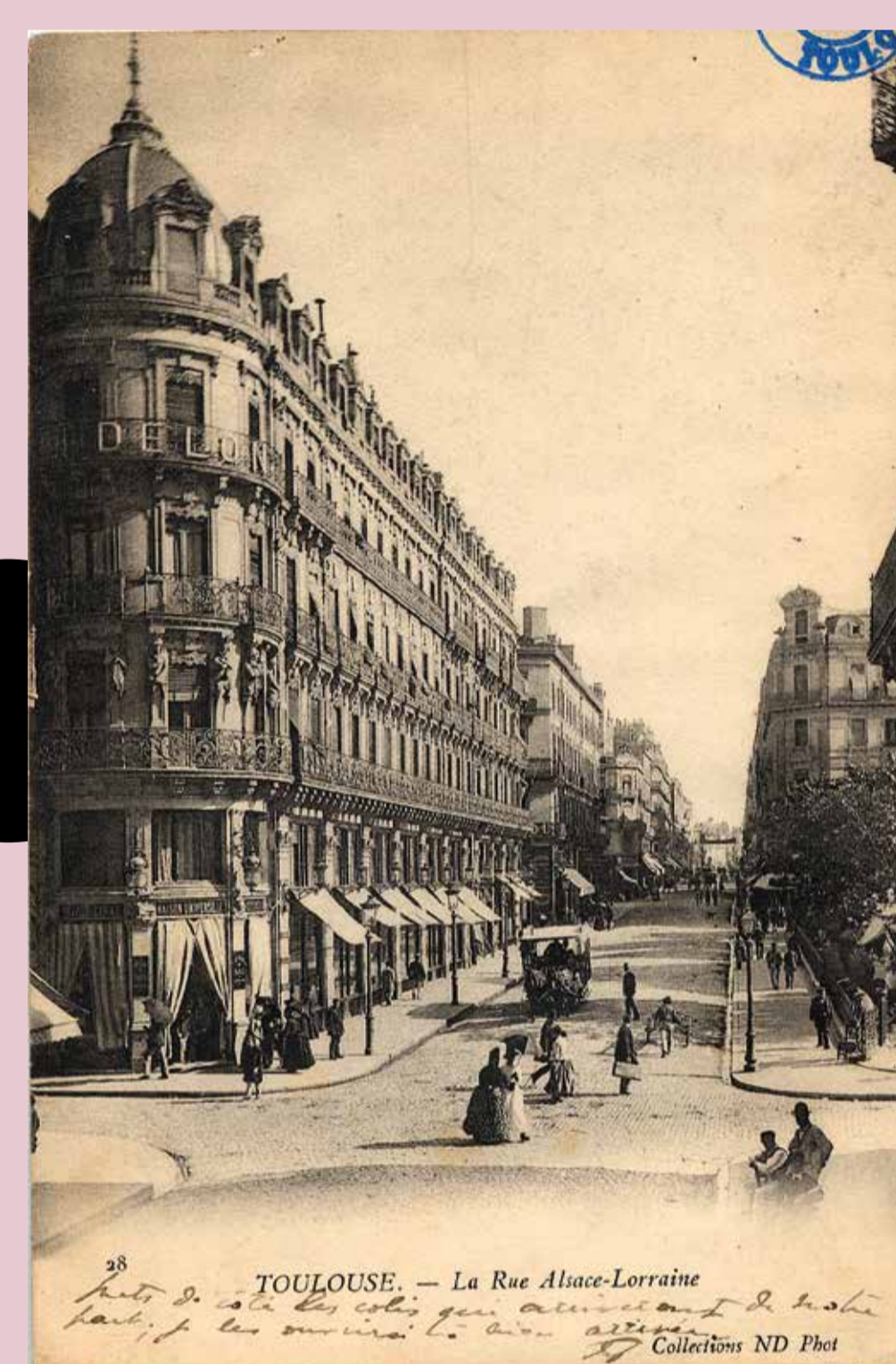
Rue d'Alsace-Lorraine en direction de la rue de Metz, depuis le croisement avec la rue Lafayette, voyagée en 1904. Carte postale photographique d'Étienne Neurdein. Mairie de Toulouse, Archives municipales, 9F111.