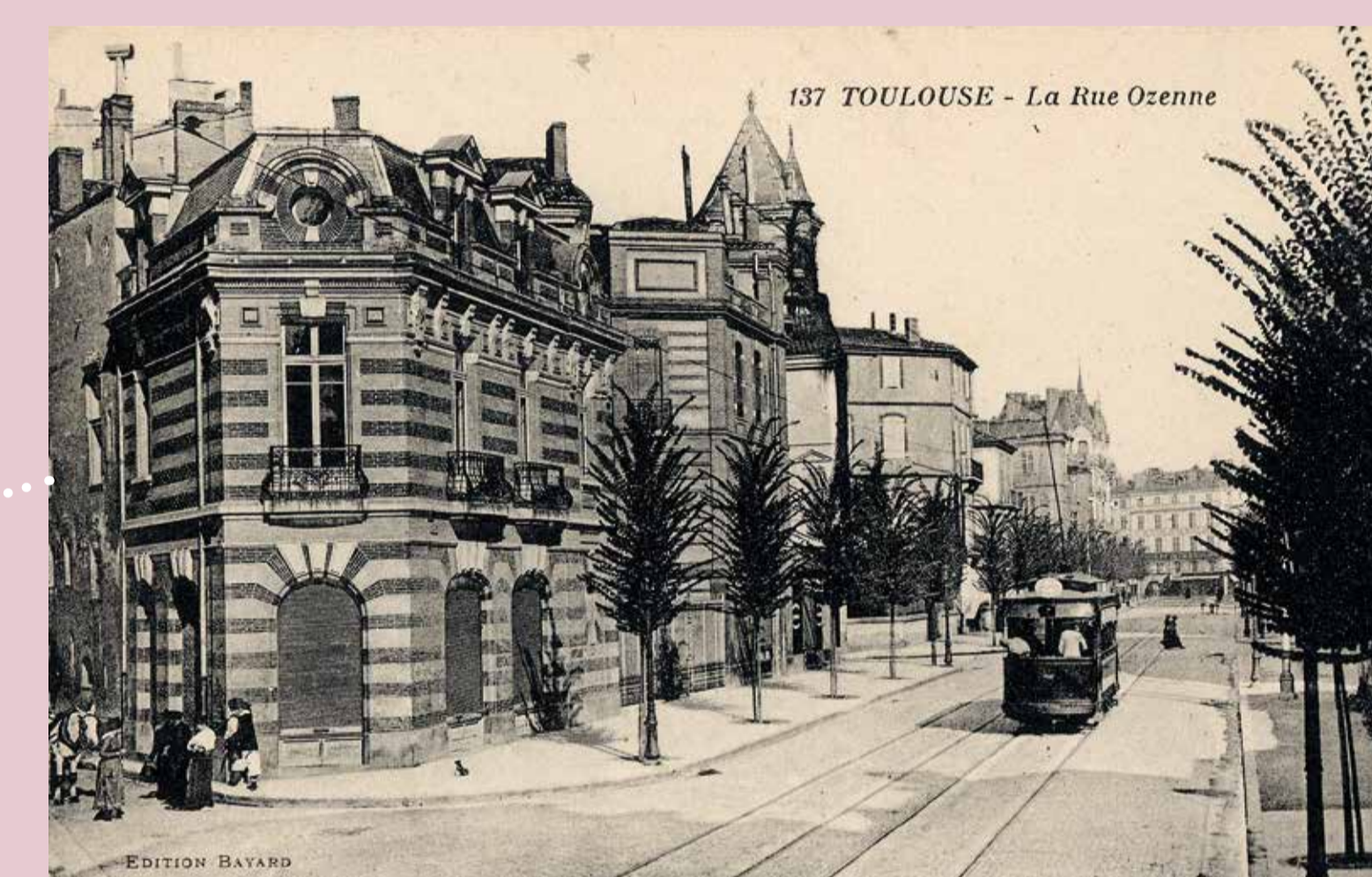
La rue Ozenne, 1910-1920. Carte postale photographique