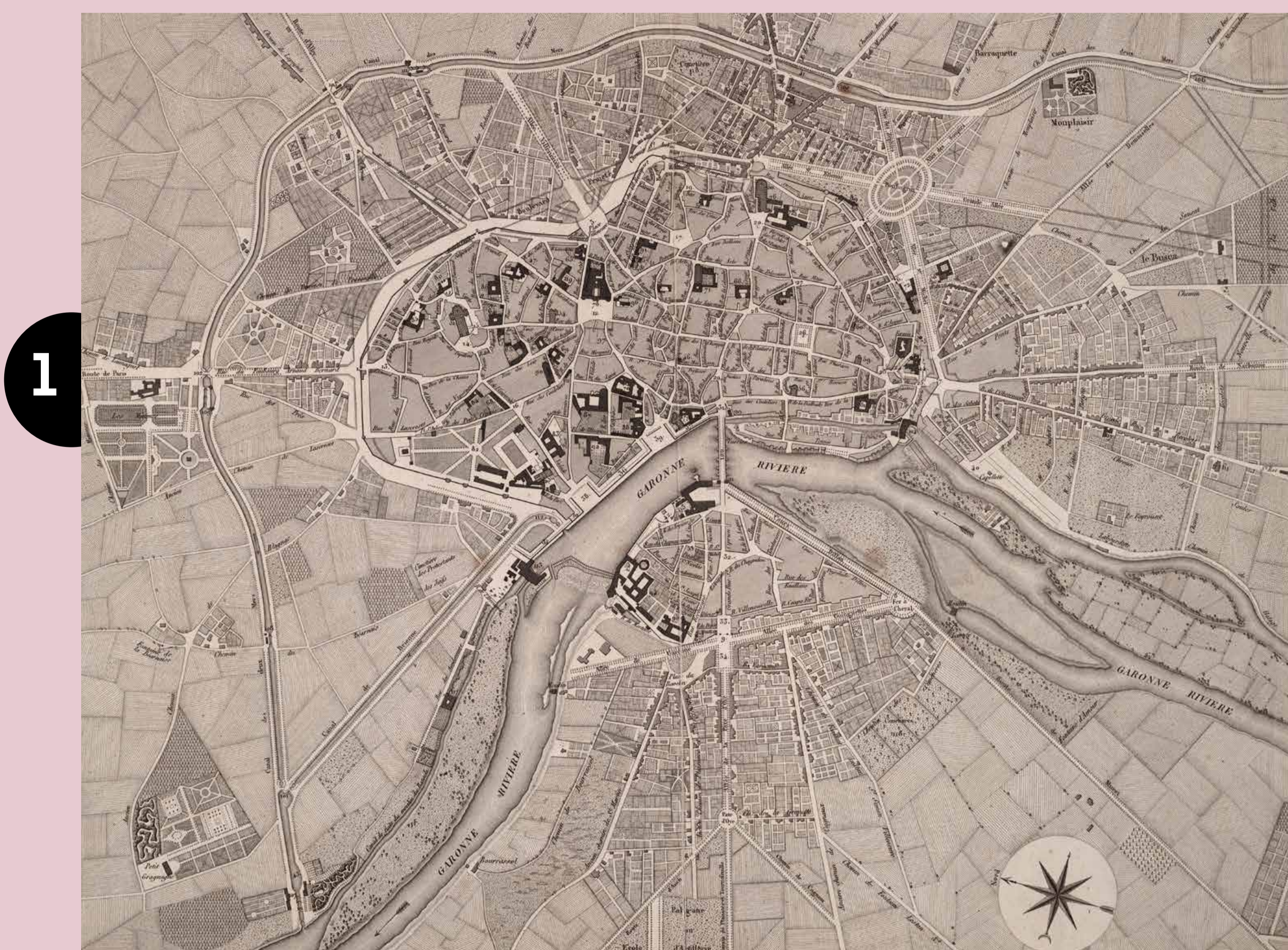
« Plan de la ville et faubourgs de Toulouse sur lequel sont tracés les principaux projets d'alignements et boulevards », 1815. Plan de Joseph Vitry, Mairie de Toulouse, Archives municipales, 20F13.