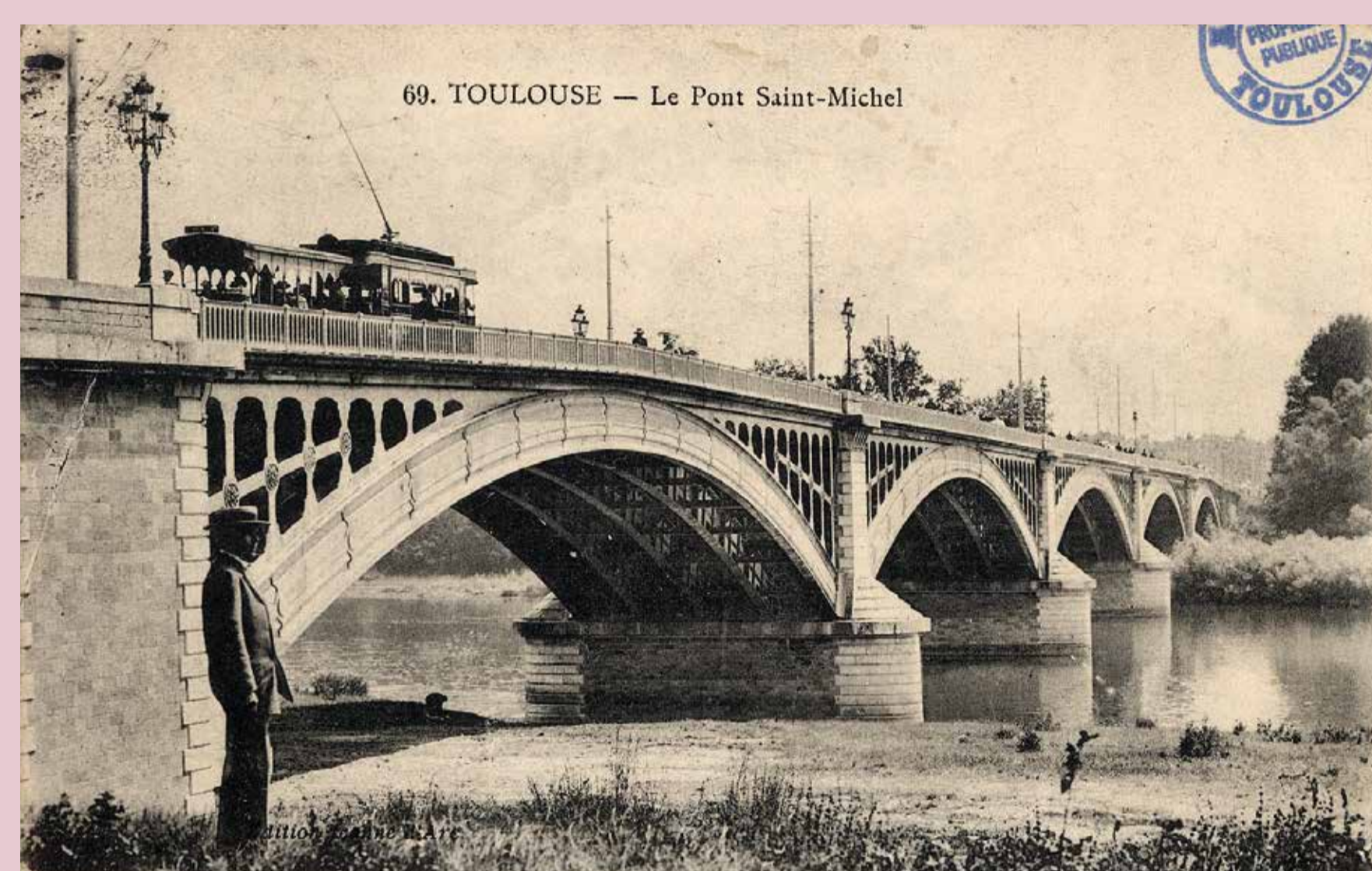
Vue du pont Saint-Michel depuis la rive gauche, vers 1910. Carte postale photographique. Éditions Jeanne d'Arc. Mairie de Toulouse, Archives municipales, 9F2631.

Après 1815, le plan d'alignement accompagne aussi l'extension de la ville en direction du nord-est et du canal du Midi. La démolition des remparts entre 1829 et 1832, remplacés par une ceinture de boulevards, assure la continuité avec les faubourgs et de nouveaux quartiers et places apparaissent. Pour soulager le pont Neuf, les ponts Saint-Pierre et Saint-Michel sont construits.