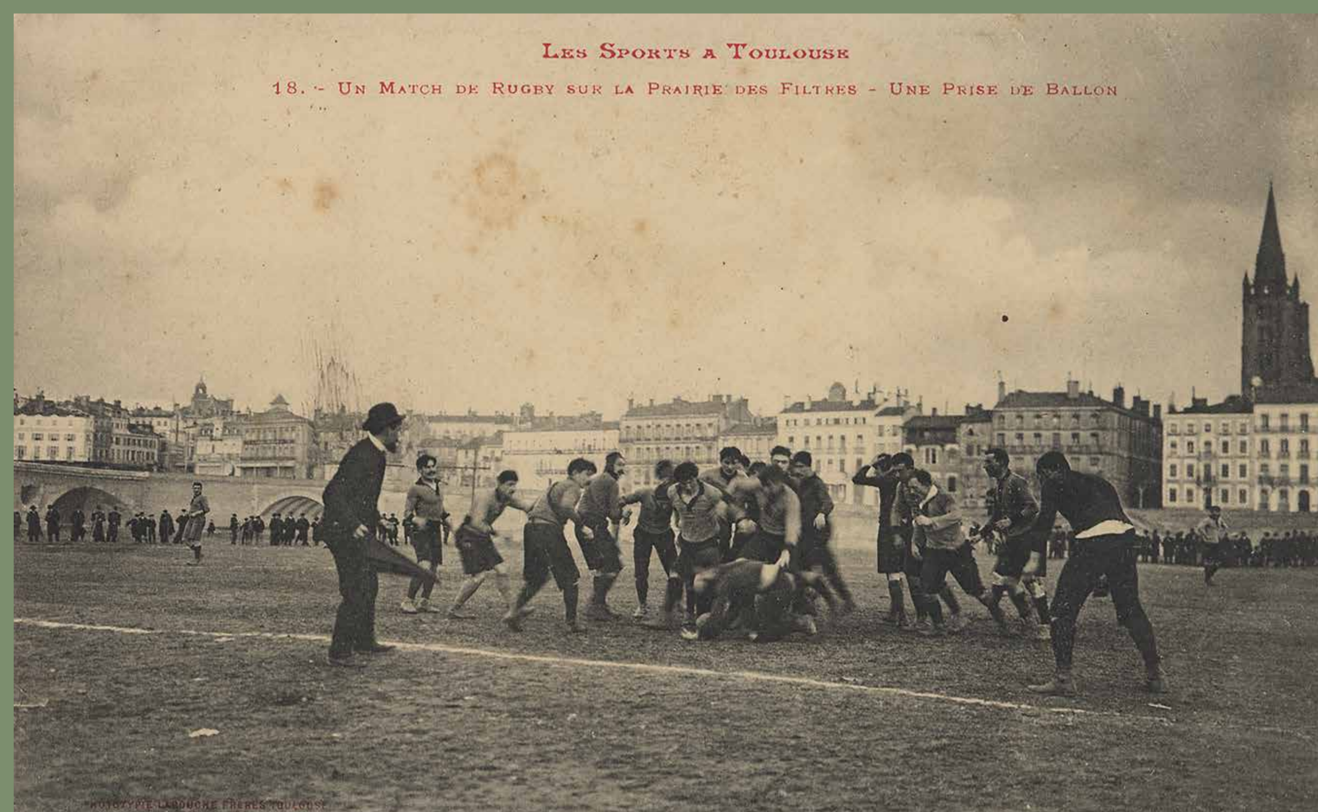
LES SPORTS A TOULOUSE 18. - UN MATCH DE RUGBY SUR LA PRAIRIE DES FILTRES - UNE FÊTE DE BALLON Match de rugby sur la prairie des Filtres, entre 1904 et 1907. Carte postale photographique, Éditions Labouche frères, Mairie de Toulouse, Archives municipales, 9F16758.

Concerts Parcs et jardins Garonne Spectacles Sports