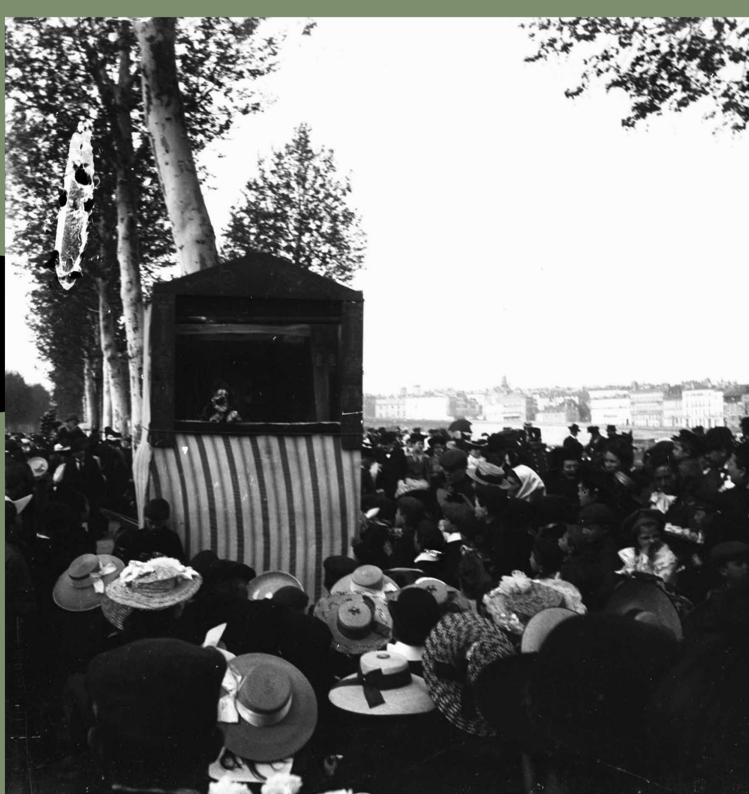
Groupe de personnes assistant à un spectacle de Guignol au cours Dillon, début du XX e siècle. Photographie, Mairie de Toulouse, Archives municipales, 6F233.