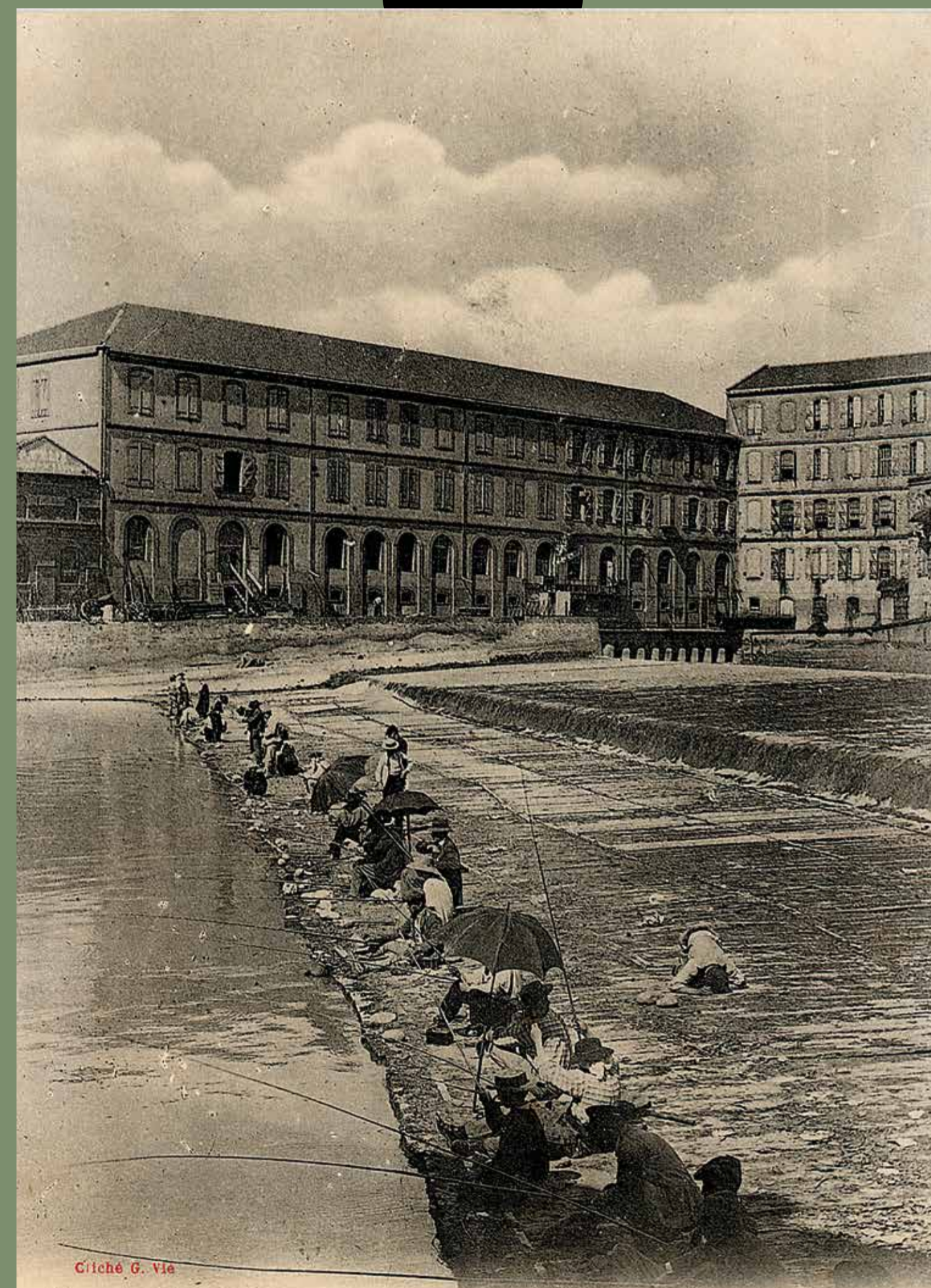
Pêcheurs à la ligne sur la chaussée à sec des moulins du Châteauneuf, sur la Garonne, avant 1904. Carte postale photographique de Gaston Via, Éditions Labouche frères, Mairie de Toulouse, Archives municipales, 9F4768.