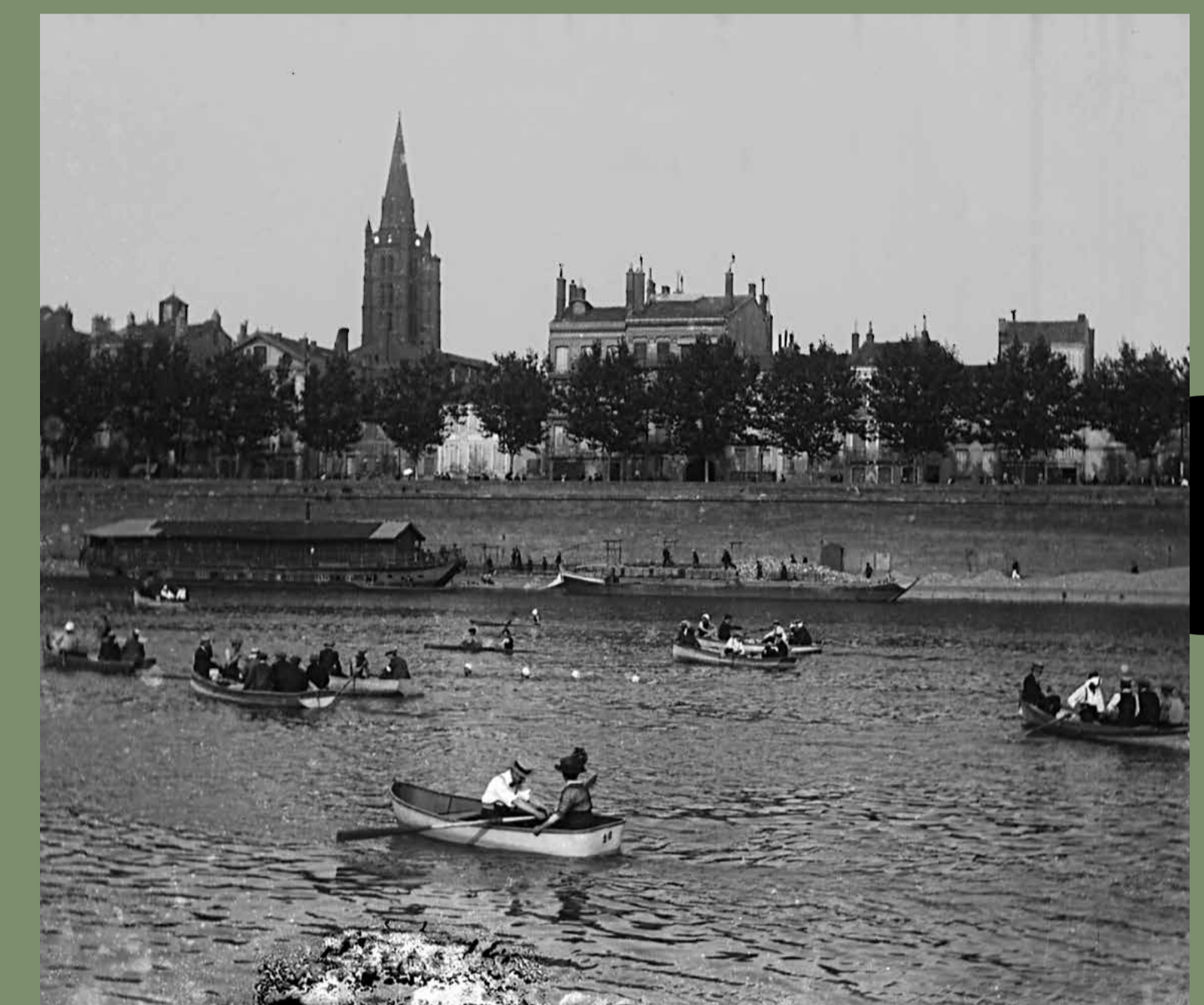
Promenades en barque sur la Garonne, entre la prairie des Filtres et le quai de Tournis, fin XIX e -début XX e siècle. Photographie d'Alexandre Gill, Mairie de Toulouse, Archives municipales, 34F2.