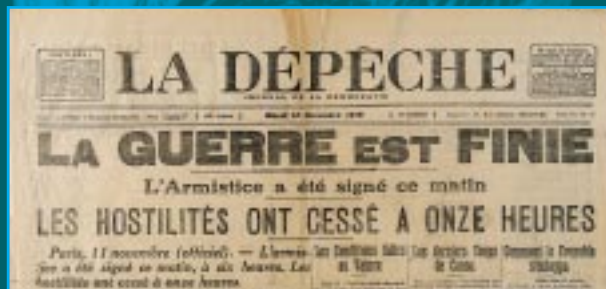
1 « La guerre est finie ». La Dépêche, 12 novembre 1918. A.M.T., PRE 14

Le lundi 11 novembre 1918, une formidable explosion de joie déferle dans Toulouse. Cent cinquante mille Toulousains saluent la fin du conflit dans les rues de la ville. Le 9 août 1919, le retour des troupes combattantes du 17 e Corps d'Armée donne lieu à une grandiose manifestation place du Capitole.