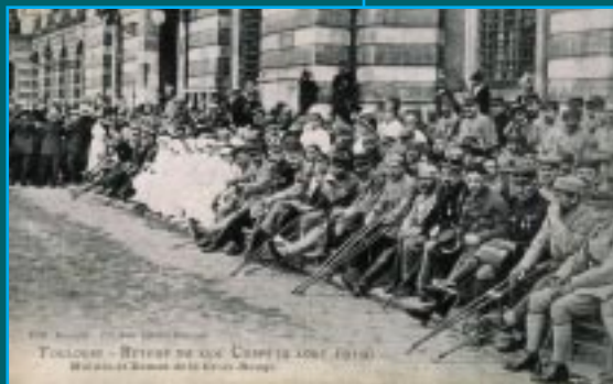
4 « Retour du 17 e Corps d'armée 9 août 1919 ». Mutés et Dames de la Croix-Rouge assis devant la façade du Capitole. Carte postale. Coll. F. Bordes.