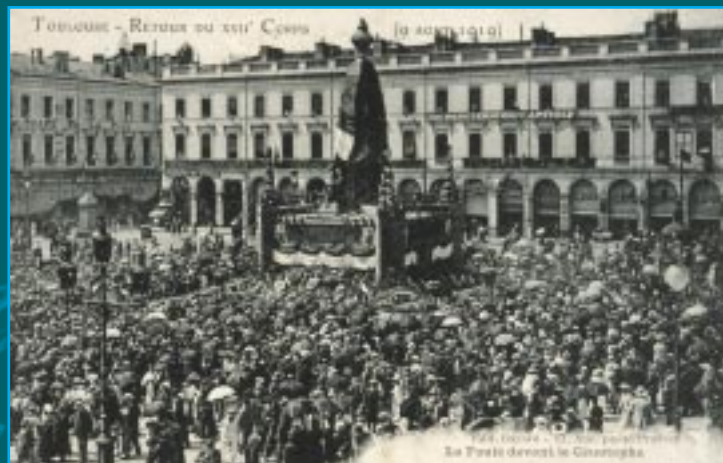
2 « Retour du 17 e Corps d'Armée, le 9 août 1919 ». La foule devant le Cenotaphe. Carte postale.