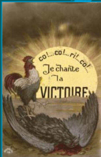
3 « Je chante la Victoire ». Carte postale.