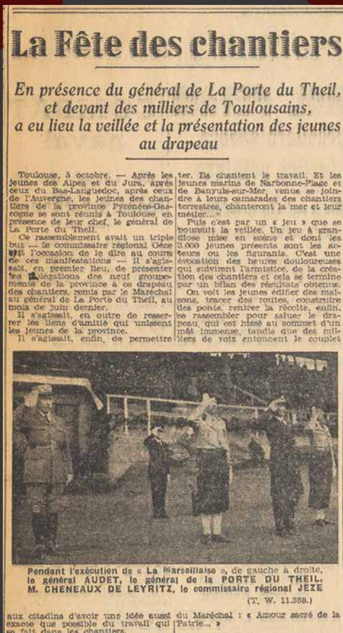
La fête des chantiers Article de presse dans La Dépêche du Midi du 6 octobre 1941 A.M.T., PRE 00