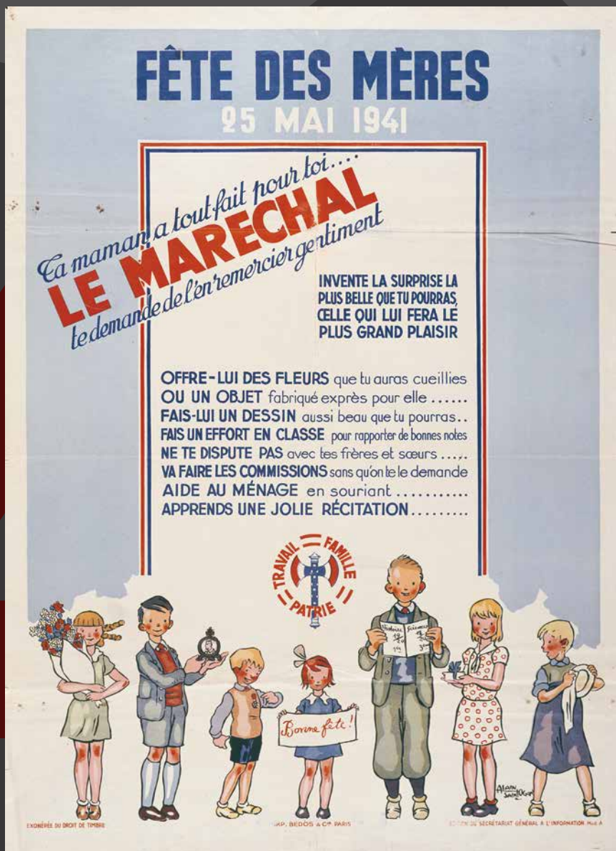
La fête des mères Affiche Centre de l’Affiche, AF 3461