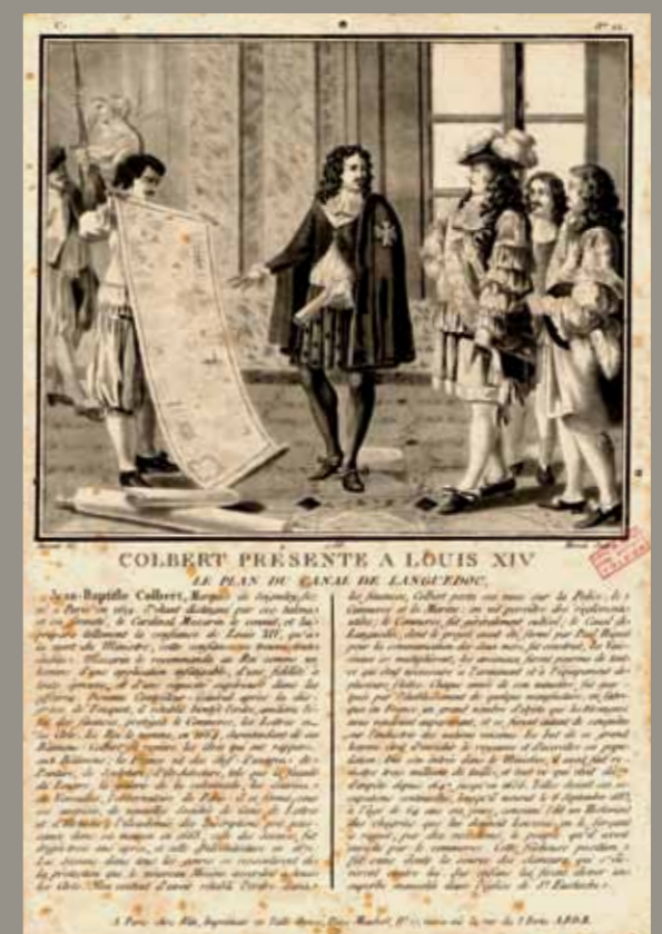
Doc 5 Colbert présente à Louis XIV le plan du canal de Languedoc. Aquatinte, 1788 Toulouse, musée Paul-Dupuy, Inv. 2750

Libéré de ses obligations professionnelles, suffisamment enrichi pour soutenir ce rêve extraordinaire, il va œuvrer jusqu'à la fin de sa vie à sa réalisation. Prenant à sa charge le financement de la rigole d'essai, argumentant