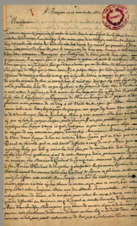
Doc 3 Lettre de Pierre-Paul Riquet à Jean-Baptiste Colbert, écrite de Bonrepos le 15 novembre 1662 au sujet du canal de navigation Atlantique - Méditerranée. Cette lettre manuscrite est une copie de celle que Riquet expédia à Colbert. Archives des canaux du Midi, Fa 001-06