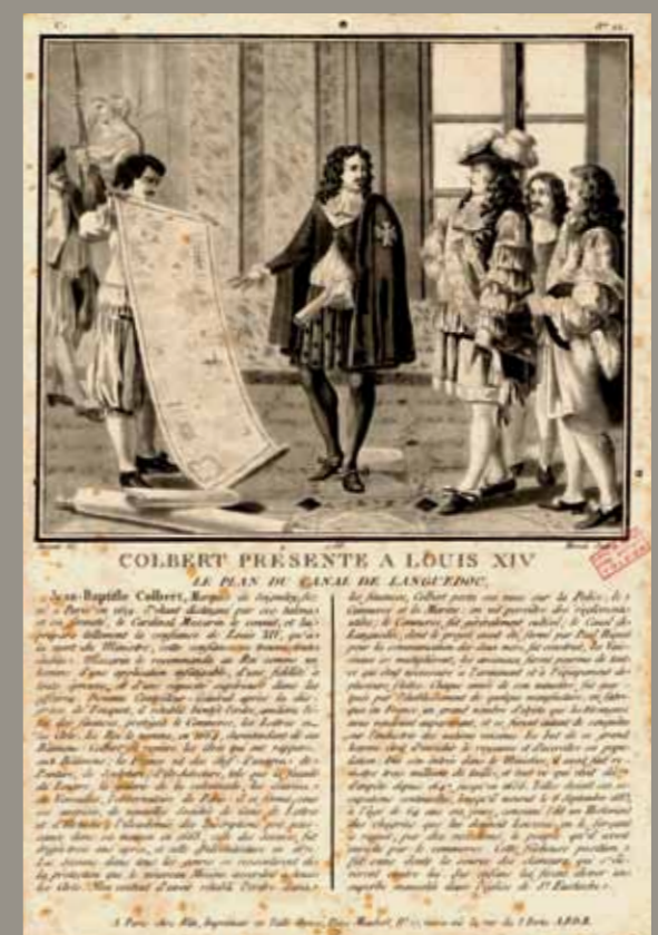
Doc 5 Colbert présente à Louis XIV le plan du canal de Languedoc. Aquatinte, 1788 Toulouse, musée Paul-Dupuy, Inv. 2750

Libéré de ses obligations professionnelles, suffisamment enrichi pour soutenir ce rêve extraordinaire, il va œuvrer jusqu'à la fin de sa vie à sa réalisation. Prenant à sa charge le financement de la rigole d'essai, argumentant