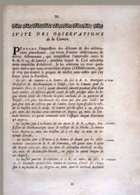
Doc 29 Cassini (Jean Dominique) Abrégé des observations et des réflexions sur la comète qui a paru au mois de décembre 1680 et aux mois de janvier, février et mars de cette année 1681, présenté au roy par M. Cassini. - Paris : chez Etienne Michallet, 1681 In-4, XXXIX - 90 p. Provenance : collège des Jésuites de Toulouse. Toulouse, Bibliothèque municipale, Fa C 2935