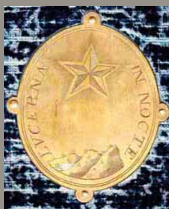
Doc 25 Registre des Lanternistes 1693-1698 Papier, couverture velours bleu avec éléments décoratifs de laiton Toulouse, Bibliothèque municipale, Ms. 1071