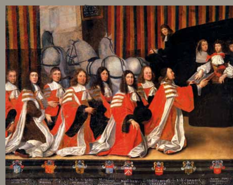
Doc 26 Chronique de l'année 1658-1659 : l'entrée de Louis XIV à Toulouse, le 14 octobre 1659.